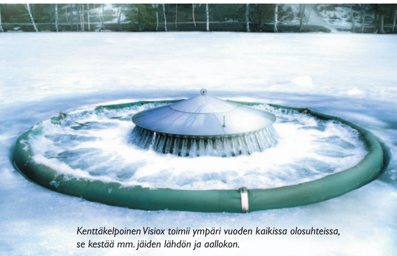
Kenttäkelpoinen Visiox toimii ympäri vuoden kaikissa olosuhteissa, se kestää mm. jäiden lähdön ja aallokon.

Järvisyvänteen huonohappista vettä pumpataan ylös ja jaetaan osasuuhkuiksi. Ilmastunut vesi ohjataan paluuputkia pitkin takaisin alusveteen.